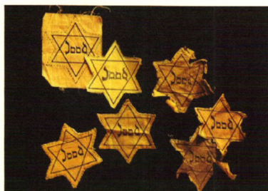
Davidove zvijezde za označavanje Jevreja

Дио треће наставне јединице у: Nastavni materijali za izučavanje opsade Sarajeva i zločina genocida počinjenog u Bosni i Hercegovini u periodu od 1992. do 1995. godine u osnovnim i srednjim školama u Kantonu Sarajevo, Sarajevo, 2018, 28.