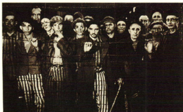
Konzentracioni logor Buchenwald