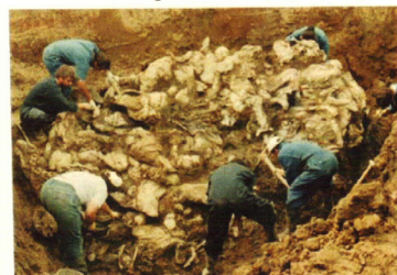
Masovne grobnice Pilica (Zvornik)

Slično kao poslije Drugog svjetskog rata, kada je svijet ostao šokiran razmjerima zločina koje su nacisti počinili na prostorima okupirane Evrope, slična reakcija je uslijedila i nakon rata u Bosni i Hercegovini. Uz pomoć nastavnika/ice uporedite ove fotografije i zaključite šta je slično, a šta drugačije u zločinima iz dva različita rata XX stoljeća.