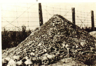
Masovne grobnice Majdanek