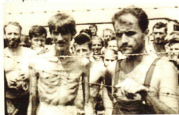
Logor za Bošnjake i Hrvate (Trnopolje)